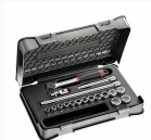
604 3/8 EA - Assortment with hexagonal sockets in ABS case (18 pcs.)