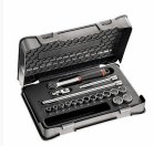
604 3/8 A - Assortment with bihexagonal sockets in ABS case (18 pcs.)